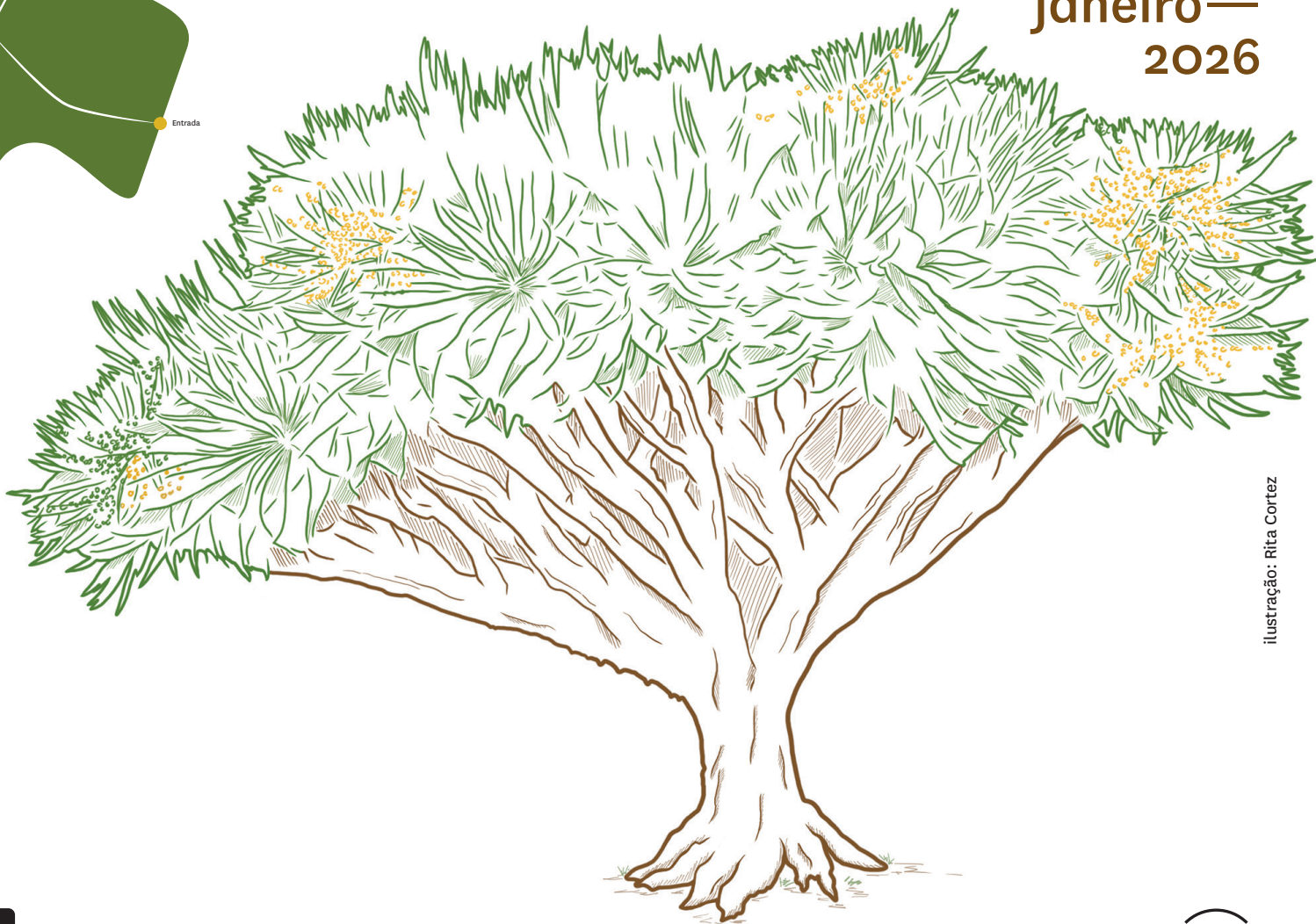
ilustração: Rita Cortez